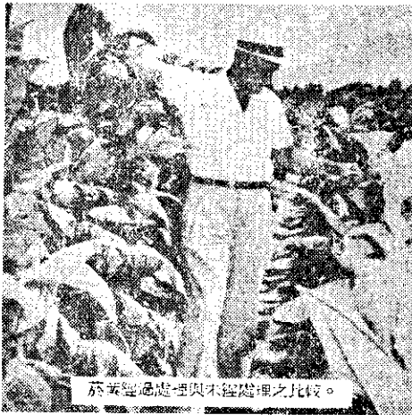
菸草經過處理與未經處理之比較。