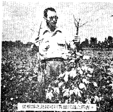
從根部之比較可以看出線虫之巨害。