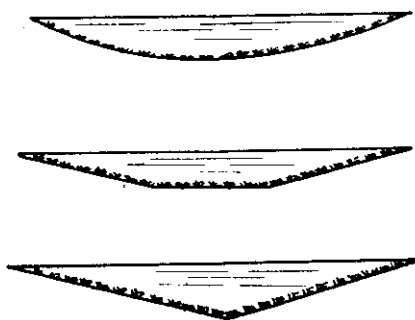
：下至上從)種三狀形面斷溝草 (形角三、形梯、形線物拋

關於這一問題，或是實際的築造技術方面，有疑問時，請向就近的水土保持工作處或工作站洽詢。