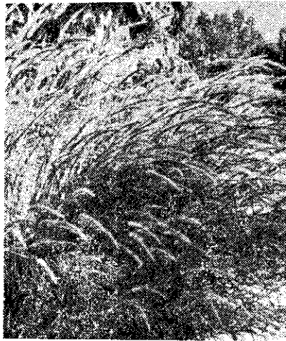
百福草的根狀生長

百福草的「有性」或「無性」的機能，如能徹底控制，在改良品種方面是很有價值的。我們可以在它的「有性」時代，利用雜交配種的方法，獲得優良特性，然後將這些特性固定在「無性」時代，就不會改變。(USIS Feature)