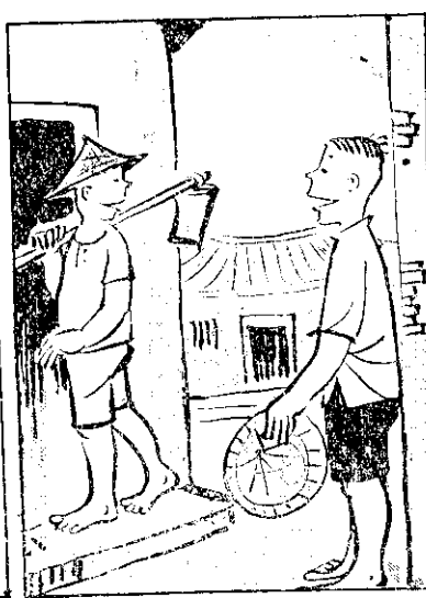
離分要漢大弟兄 理合是時已堂同代三 (己自)治加衛生力自