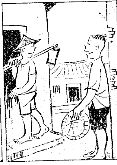
弟兄大各同自 分要門已力 離分時生 理合是加