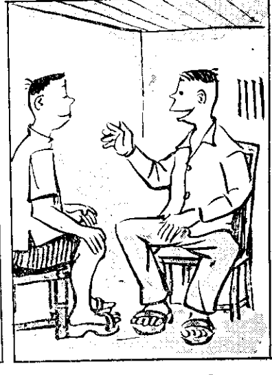
枝阿甲獅阿邊 弟兄親是也人二 時家分家死母父 海分來好和家大