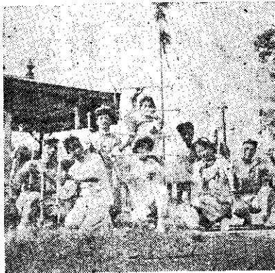
軍冠賽比蹈舞縣東屏員會鄉州南

此次聯合露營期間，適為省立臺東農校助理義指訓練的日期，他（她）們在鍾總幹事暨有關教師辛勤的教導和授課之下，三日間共同作息，共同生活，並會參加營火會節目，與鑑別實習等工作，足證鄉村與學校早已打成一片，相信他（她）們在風景好，講師好，教材好，精神好的各種條件湊合之下，必能成為指導員與會員間的好橋樑，也就是將來優秀的農村青年的領袖。