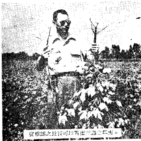
從根部之比較可以看出煙蟲之危害。