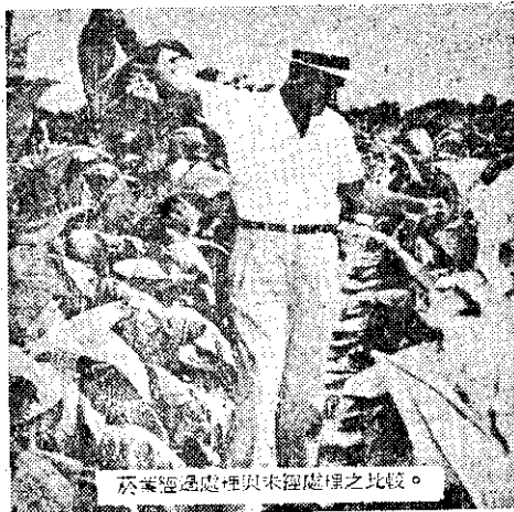
菸草經過處理與未處理之比較。