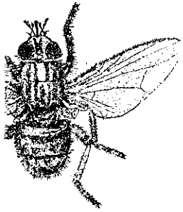
厩蠅(上)和角蠅放大圖

據美國的統計資料，因為沒有採取適當的防治措施，每隻乳牛常受近三千隻到四千隻角蠅的襲擊，由於這項為害，每隻乳牛每天減少產乳量達十至二十%，每隻肉牛每天少長半磅的肉。