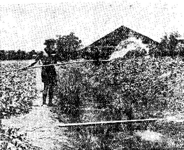
（郁宗）園菜蔬的郊市谷曼國泰

曼谷四季炎熱如盛夏，蔬菜播種後，畦面敷草可以減低土壤溫度，減少土壤水分蒸發，並防止雨水沖刷和灌水打緊土面。他們非常注重晴天灌水工作，苗期一天灌水二至三次，成長期一天灌水一至二次，始終保持土壤潤濕。這種高溫期栽培蔬菜的操作管理方法，甚為合理，可供臺灣栽培夏季蔬菜的參考。（泰國農村風光之二——郁宗雄）