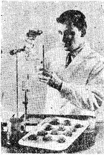
美國食品檢驗員，試驗罐頭桃子的品質。

加工食品中所用的防腐劑、着色劑、乾燥劑、香料和甜味等，都訂有嚴格的標準，以免影響消費者的健康。此外，對於農產品中的「農藥餘毒」，易於變質的海鮮加工，以及不法商人出售劣質加工品或「不誠實的標籤」，都訂有法規，嚴格取締。(USIS Feature)