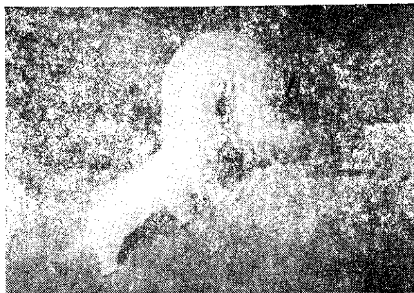
裝火煙的幼蟲(上)和蛹