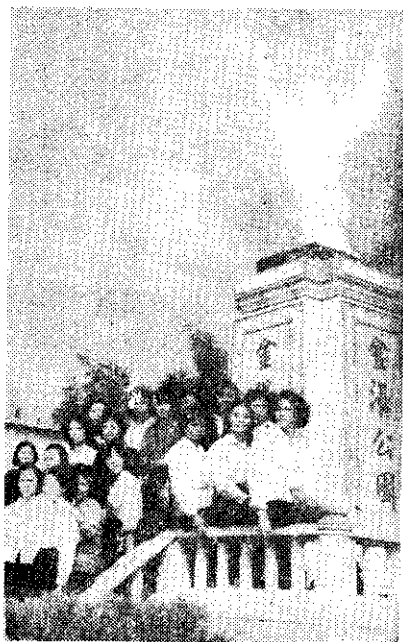
影留園公湯金在員會女鎮沙金

金沙鎮四健會，於十一月廿日舉辦自行車觀摩旅行。由九十二位男女青年騎士組成的長征隊，浩浩蕩蕩出發，沿途