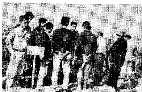
會厚觀米玉交雜雙