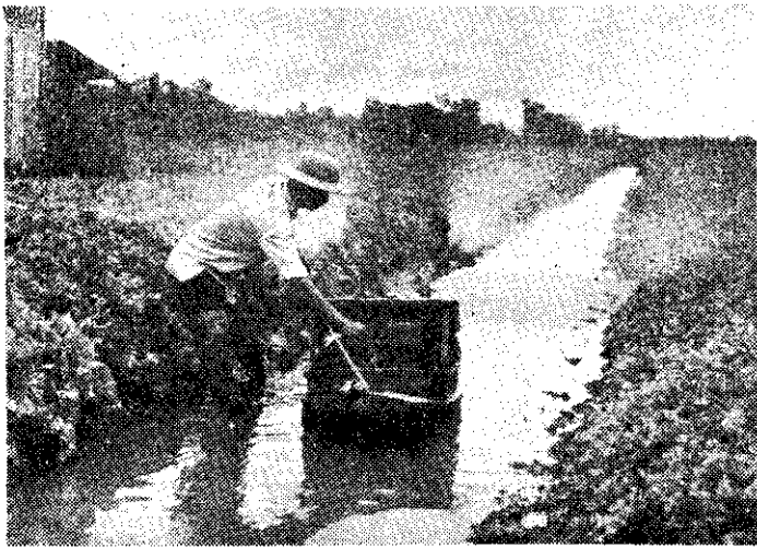
(攝郁宗) 船小澆灌水噴的園菜

小船上噴出的水，正好向左右二畦菜園，作全面噴灑灌水。同時，因抽水機吸水的物理作用，小船自動的慢慢向後移動，所以灌水很省力而均勻，效果很好。(泰國農村風光之四——郁宗雄)