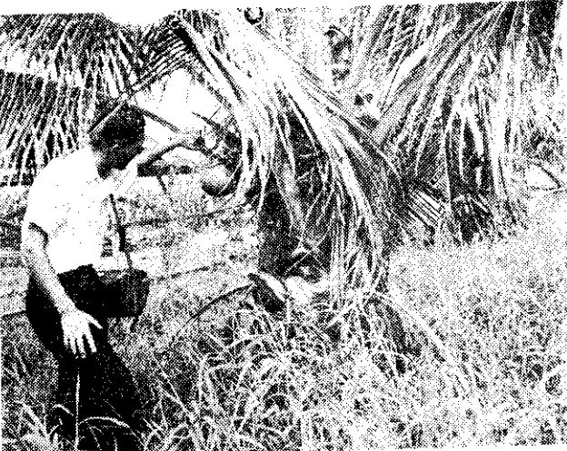
(郁宗)子椰樹採的國泰

泰國的椰子，兼有高種和矮種。高種椰子高達三十八公尺，因為採果不方便，他們就訓練一種專採椰果的猴子，可以從一株樹頂跳到另一株樹頂，輕快迅速。椰子的主人在樹下發號施令，樹頂上的猴子，完全依照主人的意思，選擇適當的椰果。 矮種椰子（左圖）常見於泰國庭園中，栽種後數年即可結果，採果也方便。但因果仁肉較薄，不適於製椰仁乾榨油，只能利用未熟果的椰汁，作飲料之用。（泰國農村風光之五——郁宗雄）