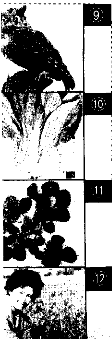
圖畫測驗印花 請照點綫剪下