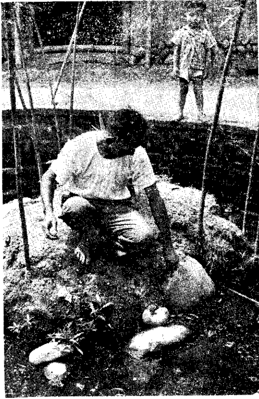
臺中市林萬壽的圓型蟹池

至於外傳成蟹輸日製藥，劉先生認為根本就不可以置信。因為日本的蟹價，每公斤日幣一千二百至一千五百圓，折合成新臺幣，比目前本省的市價約低一倍，即使能出口，也只是賠錢而不會賺錢。要想養蟹賺錢的農友，絕不可依靠這樣的幻想。