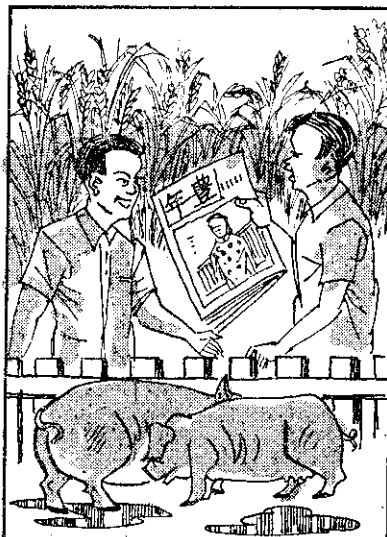
，牌老真看好「年豐」 ，代交來家專業農 。財發會錫例豬飼