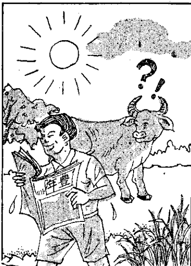
，知不那法作種 ，解了就看來「年豐」 ，見看問(信)批寫(的楚清不)無看 。來出刊「箱信業農」