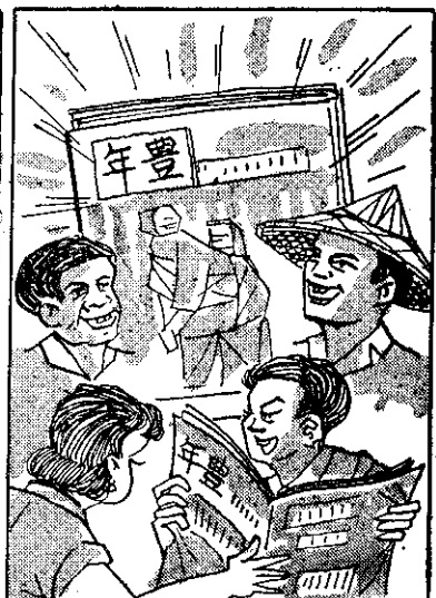
，(道入說胡)額下滿弟小是映 ，愛人人影有「年豐」 。財發會錫例豬飼