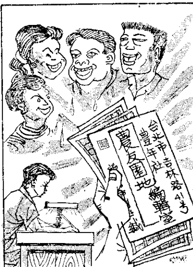
「地園左農」大家試氣免不，覽者試氣免不，愛總攬圖(默幽)科笑，裁主會輯編好