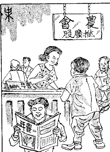
「年豐」農務服「年豐」，界林農務服「年豐」；知人農產生着為農閱訂，牌農掛有會農閱訂，財發大產增君祝