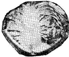
菜白心包天五十三秋夏新