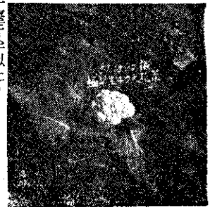
菜柳花天初夏想理早特

嘉隆一號早生甘藍菜子 早生五五五純白結晶花柳 日本長岡一號甘藍菜子 馬娜里トマト子 蘋果型トマト子 日本福壽二號トマト子 美國原裝球型洋蔥子 培法已出版，有意者付 郵三元即寄。 敏行未刊載種子應有盡有，及其他特效農藥及各 種ホルモン劑，東和牌噴霧器等，歡迎光臨選購。