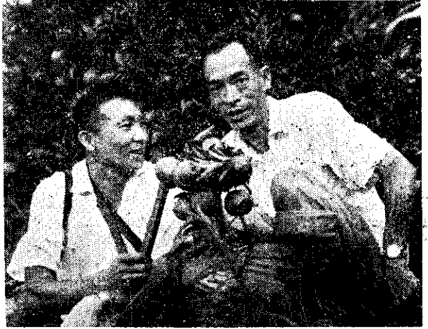
問訪者記播廣受接裏園柑在(右)友農賈字