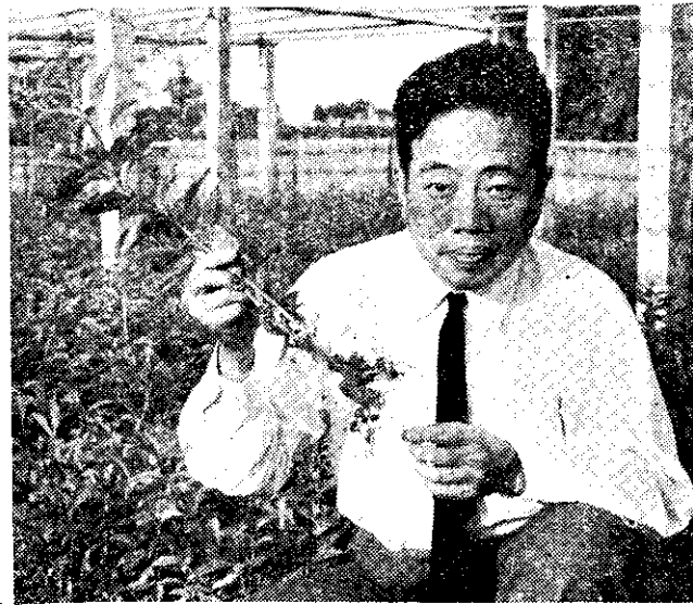
苗茶的成育法插竹用應

重肥 中剪後，立即施用氮，磷，鉀三要素。施用量因母樹的大小而異，普通樹冠直徑約八十公分的，每株宜施氮素八至十二公克，磷素三公克，鉀素五公克。母樹在秋冬茶期中絕不採摘，防止新梢側芽的發育，至於冬期施用堆肥和春茶前的施肥都照常舉行。至「春插」取梢後，就把母樹行中剪枝和施一次肥，以促進夏梢的養成，作為六、七月間「夏插」用。 選擇適地造苗圃 位置 要選擇地勢平坦，土壤酸性，避風近水源的地方。 苗床以地表五十公分以下的酸性心土，酸鹼值在四·五至五之間的砂質壤土或粘土都可以。如果是粘土，應混合三分之一的河砂。苗床最忌土壤裏有地下害蟲、線蟲和腐爛細菌，所以要採用心土，最好先用BHC或地特靈殺蟲，然後造苗床。 造床 苗床寬約一·二公尺，可以便於扦插和拔草，長度可隨地形而異，高度以水位的高低和水源的難易而不同，普通以二十公分為度。苗床土粒愈細愈好，要先把心土細碎，混