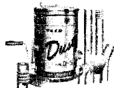
胸掛散粉散粒兼用機