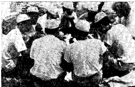
味有津津得吃餐聚員會健四和地營在姐小爾忠包