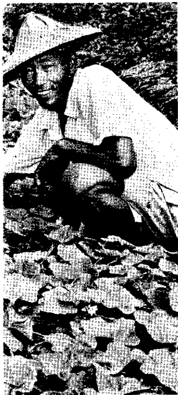
農修厥陳村東龍 。瓜甜仔糊的種友