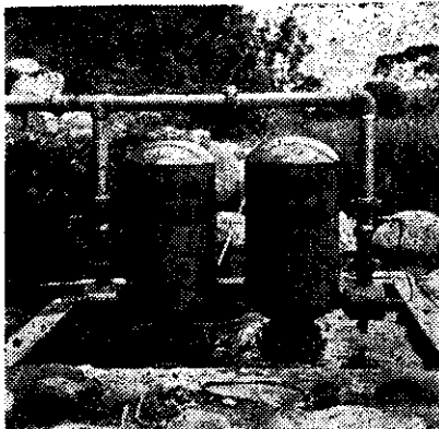
安裝於關西柑桔實驗園的利農四號自動送水機