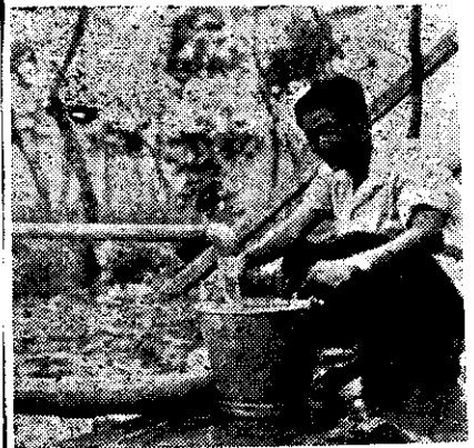
在一百公尺高的山頂，每分鐘出水量三十公升

利 農 股 有 限 公 司 臺北市中山北路三段34之1號二樓 電話：5 2 2 7 4