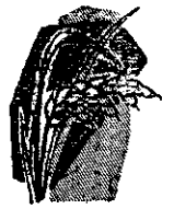
水稻插秧初期 最易染紋枯病