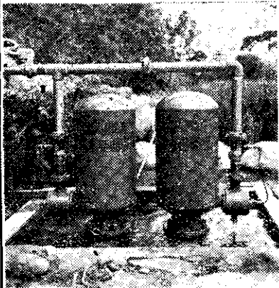
圖：安裝於新竹關西柑桔實驗的利農四號自動送水機，每天由山底送水四十三噸半至一百公尺高的山頂。

本公司的自動送水機，分活動和固定兩種。活動機可隨時向本公司申請，隨時可搬運，隨時可安裝，由本公司派工程師前往檢查，保證每分鐘送水量，三年免費修理。