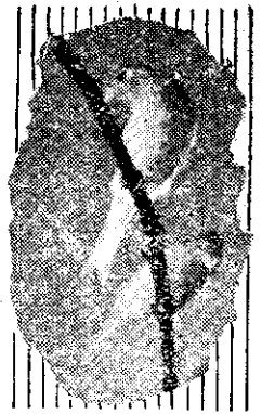
養鳥本來是一種娛樂，可是近年來，却逐漸變成一種生產事業，尤其今年二、三月間，美商星鳥公司在本省苗栗、新竹、臺中、嘉義、臺南、高雄等地貸放金絲鳥種鳥一千四百四十對，並訂收購辦法以來，大家對金絲鳥的營業飼養，更發生了濃厚的興趣。為了供給有興趣的讀者們參考，本刊記者在苗栗、新竹兩地，訪問了幾位養鳥人，請教他們飼養金絲鳥的經驗和方法。

苗栗合作農場，在今年三月初，領到了貸放的金絲鳥一百二十隻。可是由於初次飼養，經驗缺乏，成績並不理想。到七月底為止，一共生蛋五百多枚，其中，未受精的約佔一半，孵出的，因為母鳥不會喂食而又損失了一大半。同時，領養的種鳥，也死亡了二十多隻。