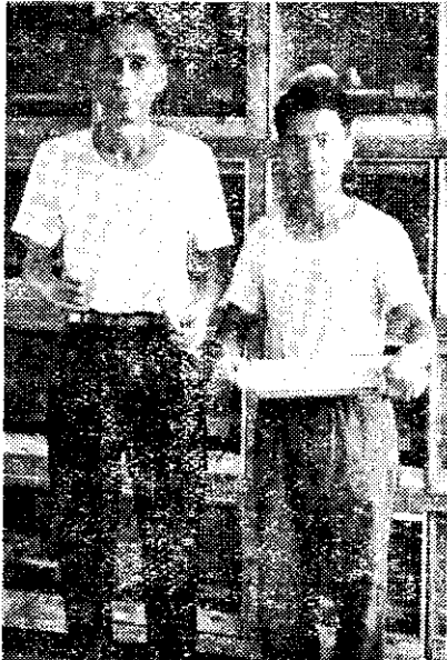
(左) 生先趙北李場農作合東苗

美國為世界金絲鳥主要消費市場，以日本金絲鳥佔外銷畜產品首位情形而論，本省由於環境（氣候溫暖），條件（以工低廉）優越，今後金絲鳥外銷是很有前途的。（普成·阿明）