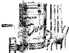
胸掛散粉散粒兼用機