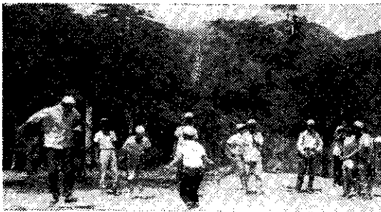
麻豆會員在知本溫泉露營歡歌載舞