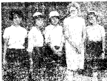
合影友會與林樹在國小商處也

屏東市長安里為慶祝縣四健會十週年紀念，特舉辦徵文比賽，作文題目由各人自定；六百字以上，二千字以內，一律用白話文。優勝及入選者可獲得獎品。(章)