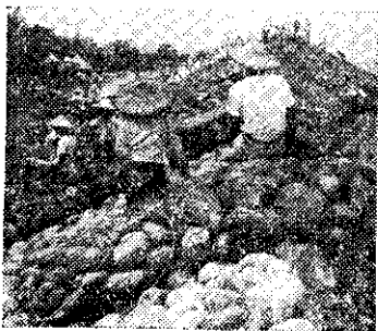
嘉義四健協助搶修堤防

不久，我們每個人又回到自己的崗位上，這樣不停地繼續工作，直到夕陽西下方才罷手，在主人千留萬謝聲中搭車回鄉。