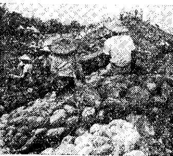
茄美四健協助搶修堤防