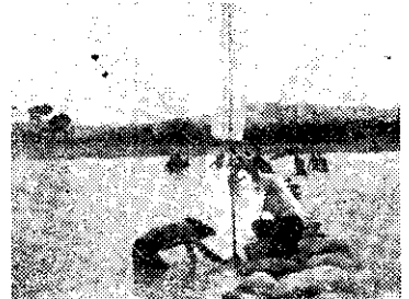
騎修助編員會份頭

，唱歌比賽，燒飯比賽，康樂表演比賽，交誼會，手工藝與營火會等等。臺南縣長胡龍寶，也會到營地巡視。(文定)