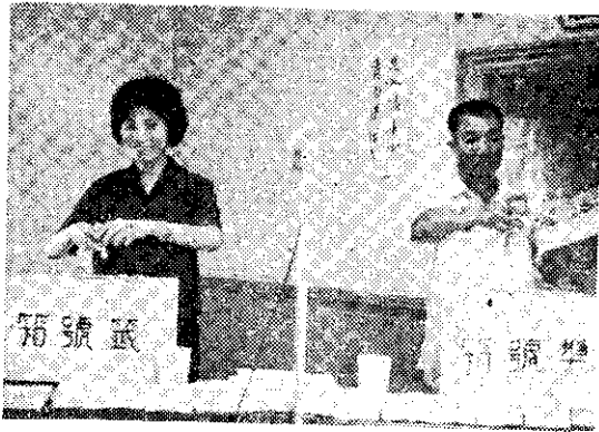
第二次徵答第一獎得主陳先生將籤號放入獎號箱。箱前即為經過編號（答對者）的來信，當籤號抽出時馬上就可知道誰是中獎者。