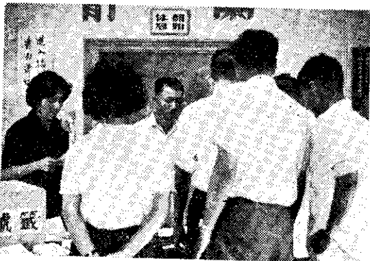
熱心的觀眾圍看抽獎實況。