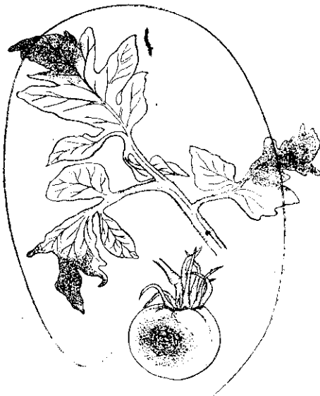
馬和 (左) 病疫晚茄番 (右) 病疫晚薯鈴