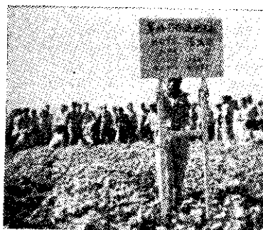
草根大使在金門參觀旱地施肥