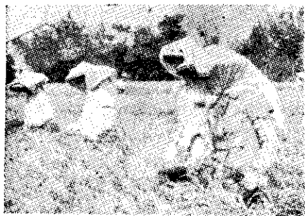
豐原鎮女會員去偽去雜比賽

新化鎮蕪拔四健會會員在烏山頭水庫舉行露營；惟「天有不測風雲」，當天明明萬里晴空，可是晚間天色大變風雨交加，營地入水，無處可睡，