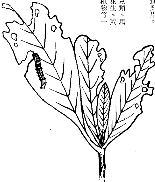
菸草螟蛉幼蟲為害狀