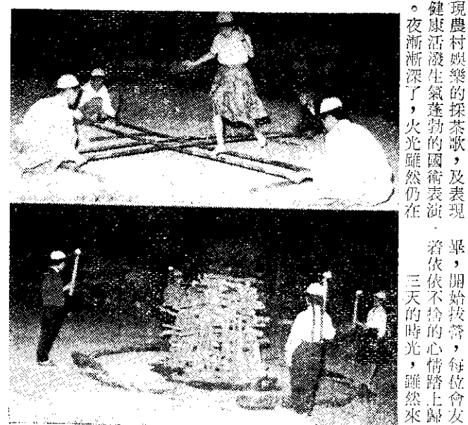
上、下、菜律須土舞舞、下、營火點前一刺

我加入四健會已一年多了，在所參加的各項活動中，最有意義而又最有興趣的，莫過於這次本縣五十二年度農業推廣教育的農事，四健、家政聯合露營大會了。露營的地點是在新竹名勝青草湖畔。