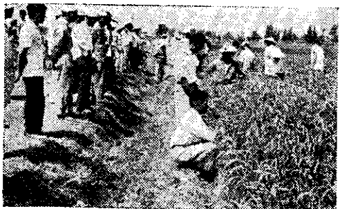
民雄會員舉行水稻觀摩賽等。會場氣氛非常熱鬧愉快。(法海)

觀摩的課程為：1. 古崗四健會員田間作業與古崗湖風景建設。2. 農試所各試作圃與禽畜飼料管理。3. 陳坑官兵休養中心。4. 太武山。5. 牧馬場與呂朝義養豬作業。6. 金沙四健會議室與田間示範作業等項。(漢根)