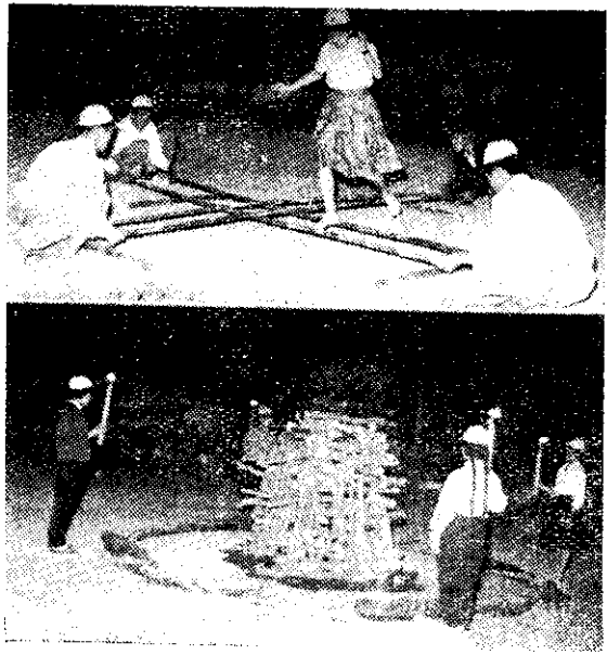
下、營火會點火前一剎

閉幕典禮和表彰大會同時舉行，優勝的單位都獲得了應得的榮譽和獎品，這是他們努力成果的，令人羨慕。典禮完畢，開始技藝，每位會友都懷着依依不捨的心情踏上歸途。三天的時光，雖然去匆匆