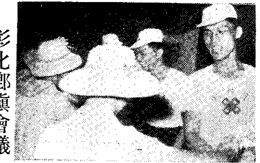
舞鼓前華和舞子獅健四化彰