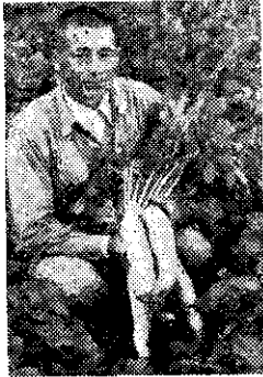
鍾爐維和五峰早生蘿蔔