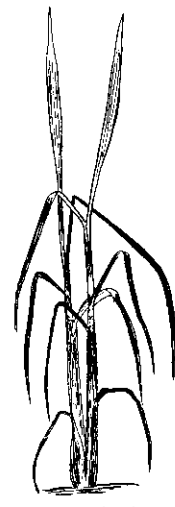
林稻害被蟲螟化二

「依必安」噴射稻莖 四十五%「依必安」乳劑加水一千倍，每公頃約用八百至一千五百公升，根據稻株大小調節藥水噴量。 藥水盡量噴到水稻莖部。插秧後一個月左右，水稻尚小時，可以將藥水由稻籬上面向下噴射。一個月後，稻株生長繁茂，葉片互相擁覆時，就要將噴頭插入行間，才能將藥水噴上莖部。 噴藥時先排去田水比較好，要特別注意噴藥時期，莖（葉鞘）被變黃時，要即刻開始防治。因為二化螟幼蟲先在最外葉鞘吃一段時間，以後才進入稻莖中心為害，中心部份被吃斷時才發生枯心，所以等到發現枯心時，被害已達到不能治療的程度。