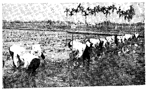
內埔舉行女子插秧比賽

滿載着，滿載着豐收的種子，撒在平原，高山和海濱。集合着各種生產之道似一條奔流的長流。源源地不斷地灌溉在古銅色人們的心田。看呀，種子已經茁長開花。起伏於田野間黃澄澄的稻浪。林木在風中搖曳牛羊在陽光中漫步澆刺有聲是河池中的魚兒活躍在大地的眼前誰個不感「豐年」這辛勤的汗水。