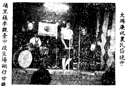
大埠慶祝農民節晚會