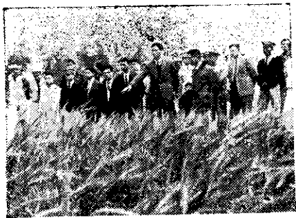
大甲農校學生插秧和參觀麥田

大甲農校四健會於二月六日，利用該校交通車，舉行一次會員觀摩旅行，參觀正在開工的月眉糖廠，瞭解製糖程序；參觀臺中改良場，獲得農業新見聞；參觀養雞場，得到許多養雞知識。在旅途中或歌唱，精神飽滿，會員忘却了一天的疲勞，又該校四健會於寒假期間，分成畜牧、加工、農機具、測量、農藝及家事等六組，給每一會員自由選擇實習，以增進會員作業技能，提高作業興趣，養成在工作中學習，在學習中工作之精神。(劉俊衡)