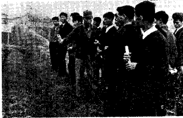
場良改農嘉觀參甲六

六甲鄉四健會為啓發四健會會員興趣，增加新智識、新技術，藉以能達學以致用，特辦臺灣中北部觀摩訓練，地點包括嘉義農業改良場，水稻育種試驗，桃園順隆當歸苗，士林鎮四健柑桔栽培，及中國農業機械公