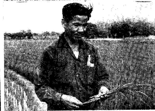
(俞港比較稗草水稻根部發育)

農友們拔除稗草，常常不論有無開花結實都隨便亂丟。把稗草丟在田埂、馬路旁或河川裏，無異就是幫助稗草繁殖！所以，拔除的稗草，除了還沒有開花結實的可以用來餵牛或作堆肥外，已經開花結實的，一定要收集成堆，放火燒掉。