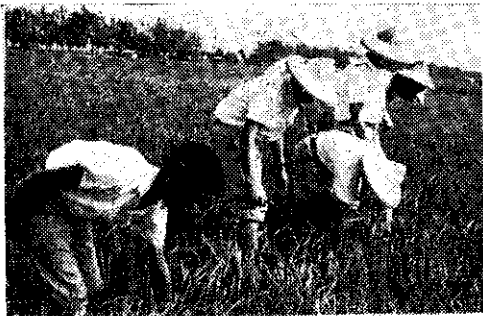
卅子四健會去偽去雜

后里農校於五月十日下午在農場舉行示範比賽，共有十一項：一、母、公兔怎樣監別。二、闖雞方法。三、闖豬。四、兔的脫皮。五、蕃茄整枝。六、水稻選種。七、水稻