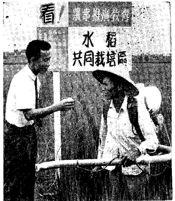
(攝銘少唐) 問訪者錄受接(右) 友農堂阿黃