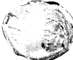
▲早生 天結球白菜：下種期：農曆三月下旬至八月上旬止 ▲晚生 天結球白菜：下種期：農曆三月下旬至八月上旬止

▲農友們的大福音：在春夏秋冬以下種栽培各種品種：由二代七十餘年之經驗蔬菜種子專家，環球唯一有名清河種子行的最新改良各種優良品種供應國內外農友們安心栽培希請勿失良機敬請歡迎選購利收益。 ▲一九六二年最新改良成功之新理想高脚菠薐菜(牛若丸)下種期農曆六月至四月止保證不抽苔