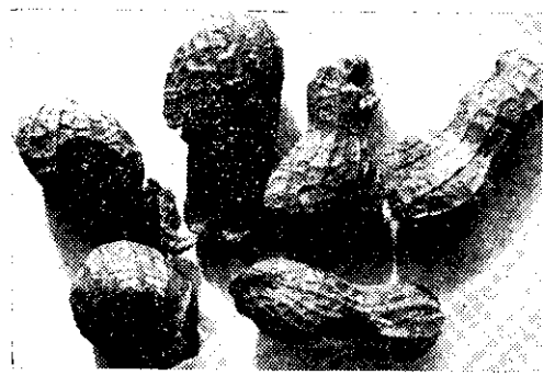
(形情花生害為蟲幼子龜金)