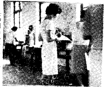
廢物利用比賽來賓評分

總之，我參加四健會之後，不管是學識、技能、品德消閒生活……等等，都有了大大的改善，好處不勝枚舉。