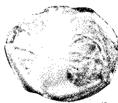
▲新夏 粉葉結球白菜：下種期：農曆二月下旬至七月上旬止 ▲秋三五 天結球白菜：下種期：農曆二月下旬至七月上旬止 ▲秋三五 天結球白菜：下種期：農曆二月下旬至七月上旬止

▲農友們的大福音：在春夏秋季可以下種栽培各種品種：由二代七十餘年之經驗蔬菜種子專家，環球唯一有名清河種子行的最新改良各種優良品種供應國內外農友們安心栽培希請勿失良機敬請歡迎選購俾利收益。 ▲55天純白結晶花椰菜，下種期五月至七月。 ▲60日長（短）葉純白結晶花椰菜，下種期六月至九月末止。 ▲早中生55天黑葉結球白菜，下種期七月上旬至九月末。